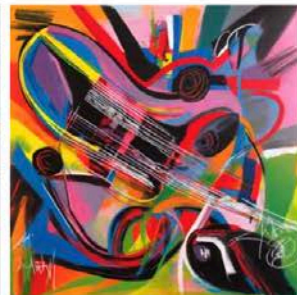
AIアート画像 タイルテクスチャの影響を排したカナブストラクドによる「無題」