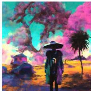
AIアート画像 弓矢の影響を排したカナブストラクドによる「無題」