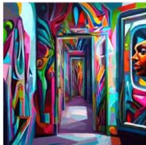
AIアート画像 深斎英泉の影響を排したカナによる「無題」