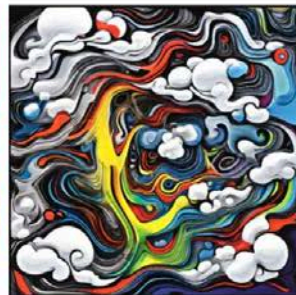
AIアート画像 マラケシュの影響を排したカナブストラクドによる「無題」